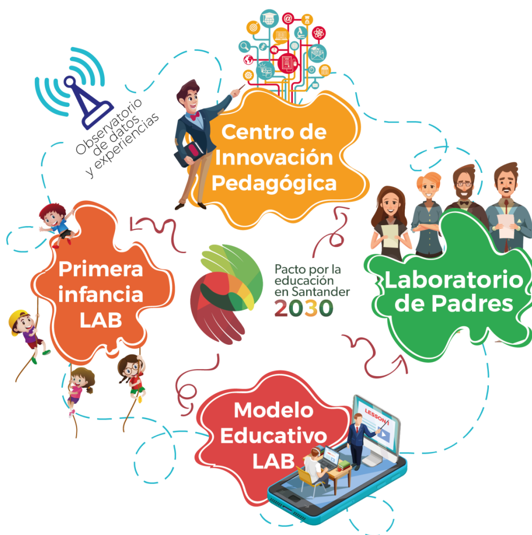
Ilustración 1. Esquema general del Por la Educación de Santander

En las interacciones desarrolladas en el proceso de construcción colectiva, se identificó el patrón de repensar las prácticas tradicionales que desarrollan las actuales Instituciones Educativas. Como Einstein dijo en su famosa frase: “No podemos resolver problemas utilizando el mismo tipo de pensamiento que usamos cuando los creamos”. En este sentido, se plantea la necesidad de re significar el rol de los actores educativos y de las prácticas de aprendizaje, a experiencias que permitan la cocreación, con agentes activos codiseñadores y conectores que ayuden a los